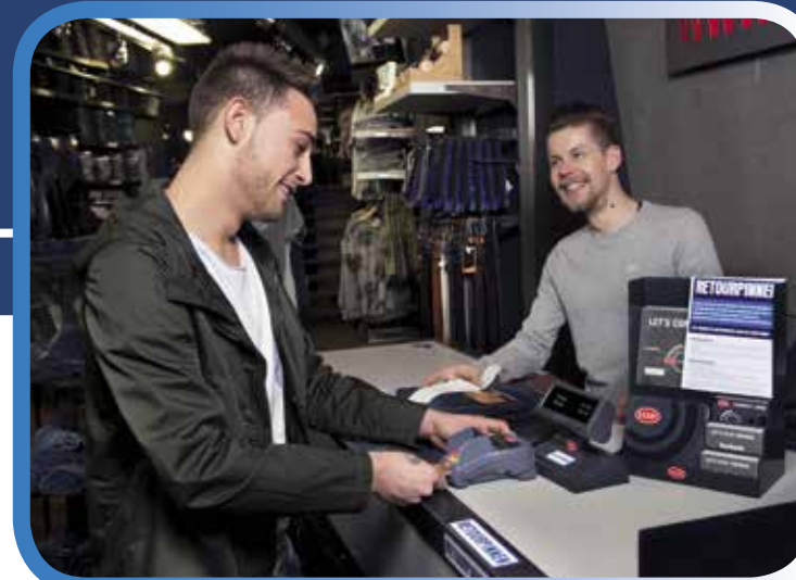
Score Utrecht was de eerste winkel in Nederland waar Retourpinnen mogelijk is.

Het grote voordeel van Retourpinnen is dat u geen grote hoeveelheden contant geld hoeft aan te houden voor als klanten iets komen retourneren. Dit is veilig en handig en past helemaal in de trend om zo min mogelijk geld in de kassa te hebben. Het maakt niet uit waar uw klant bankiert: elke betaalpas is geschikt voor Retourpinnen.